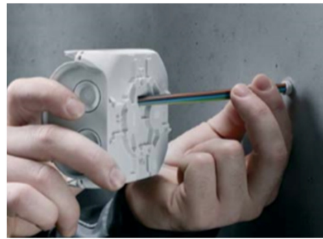
Kabelgenomföring i botten via ett elastiskt membran.