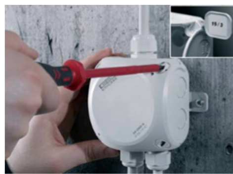
Snabbstängning med kvartsvarvsskruvar.