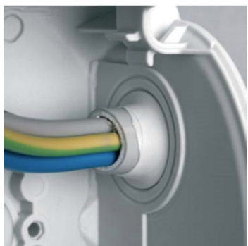
Kabelgenomföring via elastiska membran.