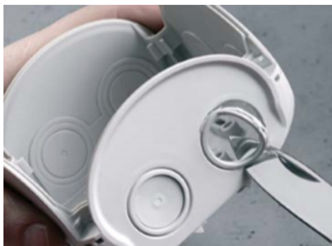
Alternativt, en kabelförskruvning kan användas efter att membranet avlägsnats.