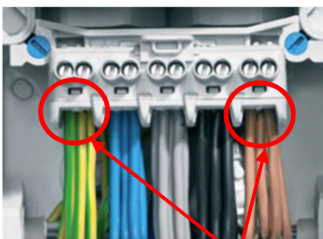
Stor valfrihet i anslutningarna