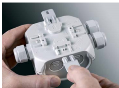
Yttre fästörön följer alltid med.