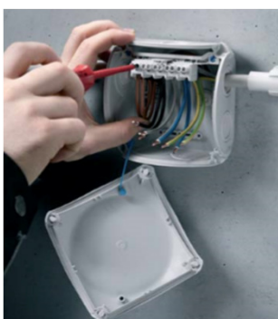
Lockhållare hindrar locket från att trilla ner.